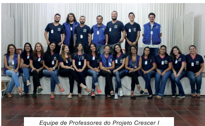
Equipe de Professores do Projeto Crescer I

Sempre preocupado com a qualidade e as tendências educacionais, o Projeto Crescer oferece atividades para formação de seus educadores desde 2015, ano em que se implantou a nova metodologia de ensino. O processo constante de aperfeiçoamento é de suma importância, pois ajuda o professor a melhorar cada vez mais suas práticas pedagógicas e apoiar os alunos na construção de seus próprios conhecimentos.