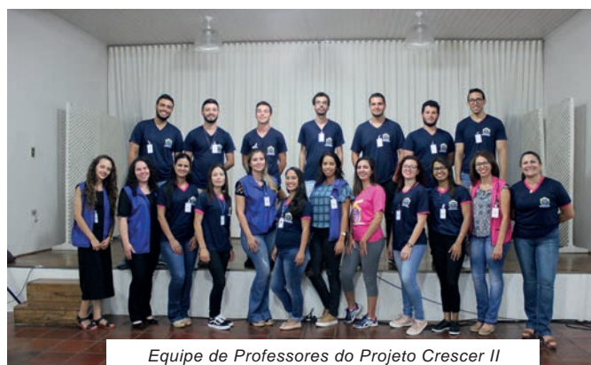
Equipe de Professores do Projeto Crescer II