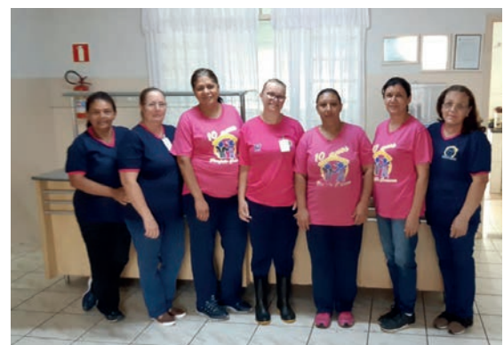
Equipe que atua na cozinha do Projeto Crescer: mais de 120 mil refeições servidas em 2018

Para acessar o balanço completo, digite: www.projetocrescerarapongas.org.br , e clique na aba "Transparência".